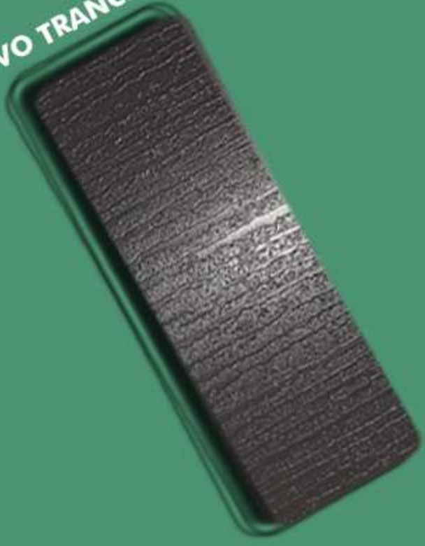
NUOVO TRANCIATO – NT