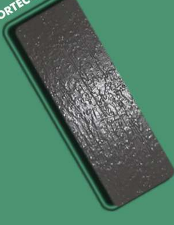
CORTECCIA – CT