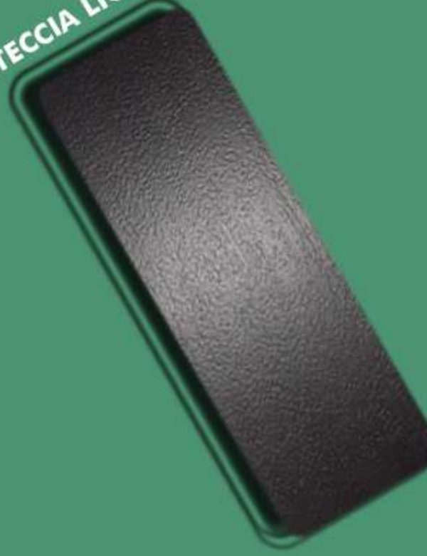
CORTECCIA LIGHT – CH