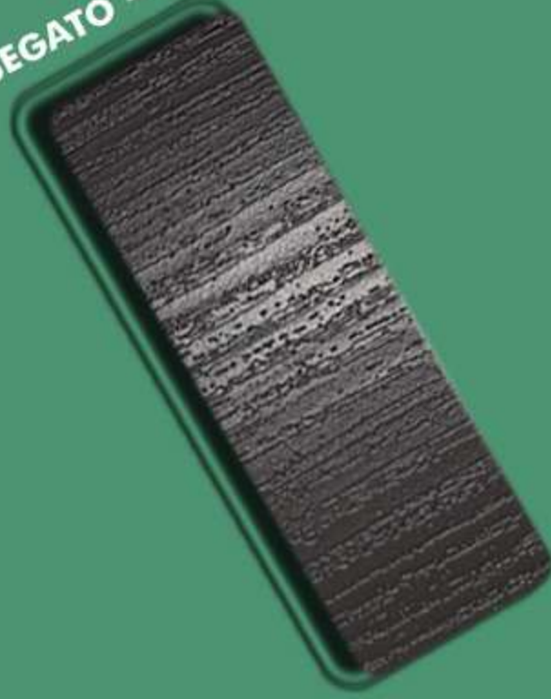
SEGATO – SG