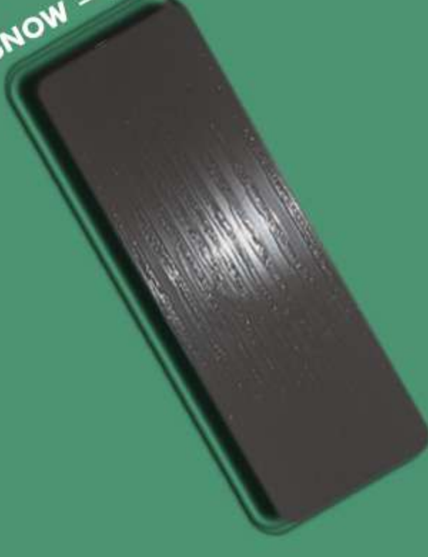
SNOW – SW