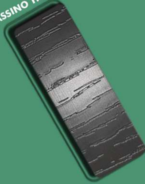
FRASSINO TRAV – FT