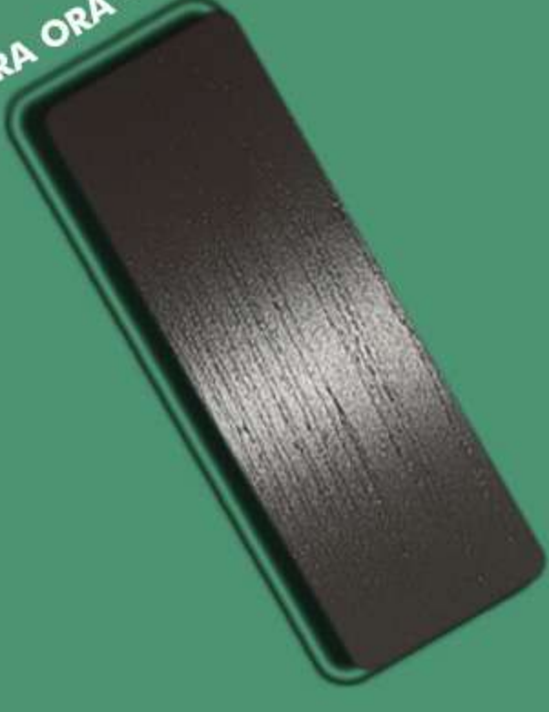
ERA ORA – EO