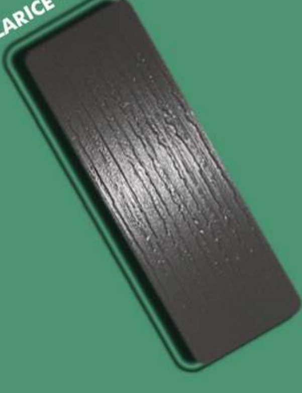
LARICE – LR