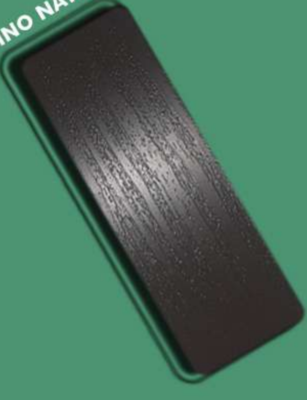
FRASSINO NATURALE – FN