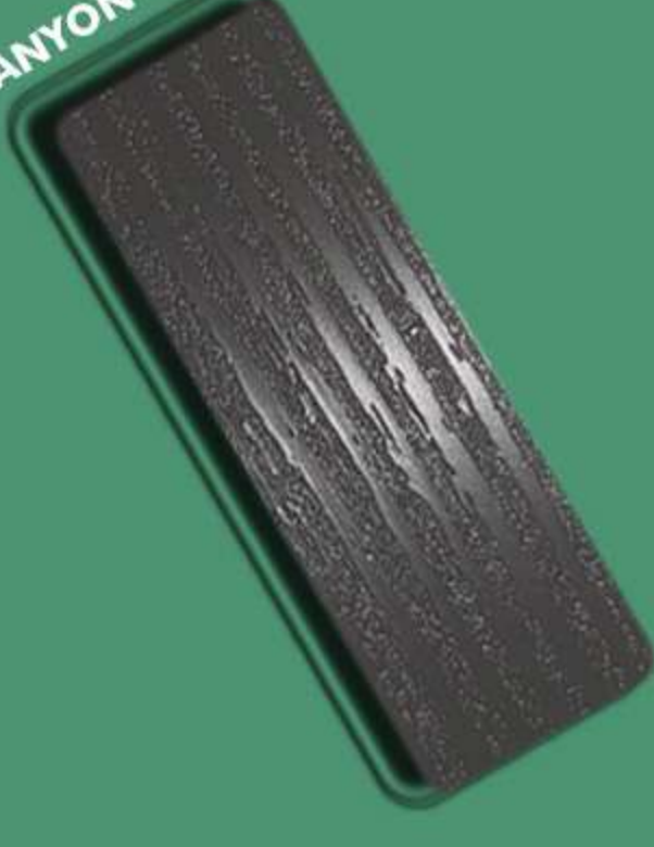
CANYON – CY