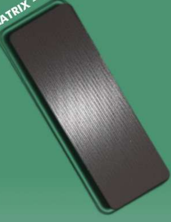
MATRIX – MX