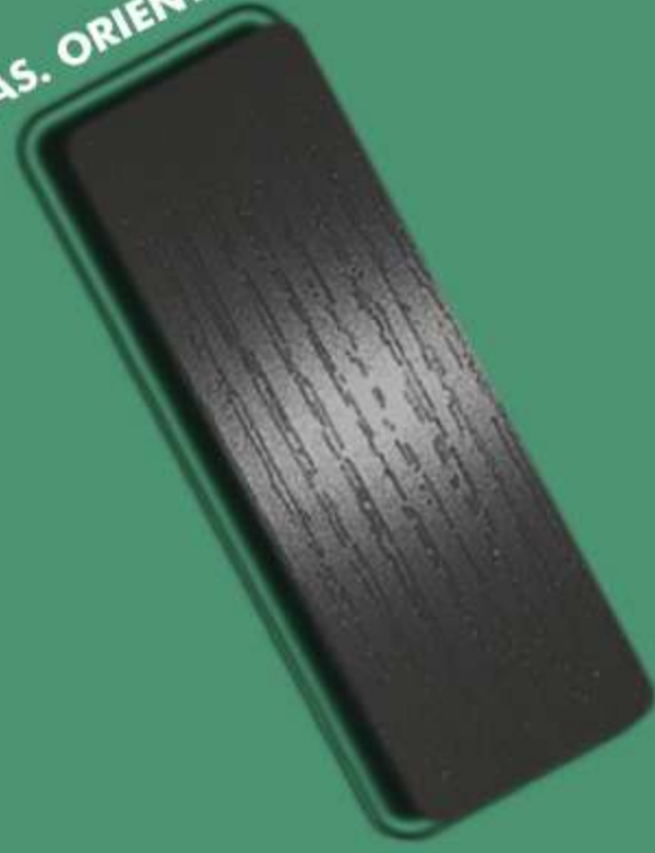
FRAS. ORIENT. – FO